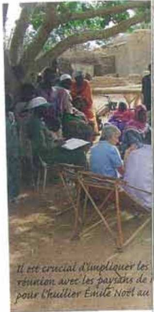
Il est crucial d'impliquer les réunions avec les paysans de pour l'huillier Emile Noël au

assoient leur autonomie a La double mention, bio est sans doute l'une de garanties pour se prémun taines dérivés. C'est d'ail de la charte qu'ont adopté quelques petites et moyen- nes entreprises françaises (Belle- donne, Euro-Nat, Émile Noël, Arca- die, Kaoka, Argan- dia...). Car comment préte les êtres humains quand o